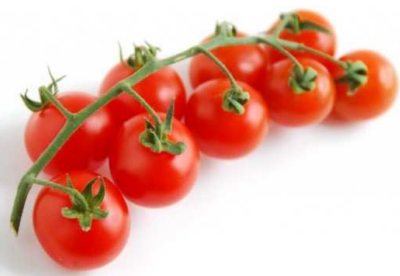
Pomidory 1,5 kg